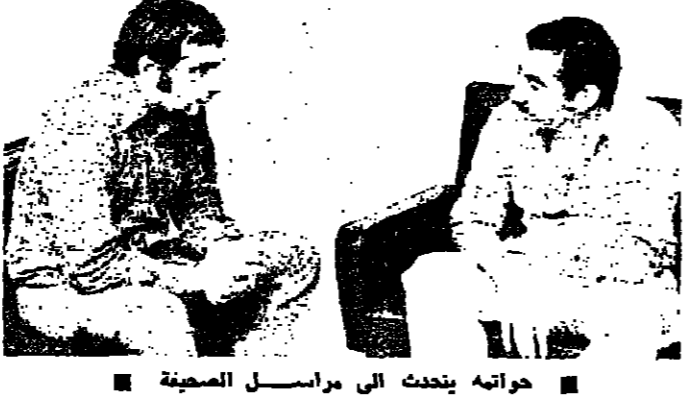
حواته يتحدث الى مراسل الصحيفة

قال السيد نايف حواتية الأمين العام للجنة الديمقراطية لتحرير فلسطين في مقابلة مع صحيفة «الاصدي» الصادرة في سبيلنا بولونيا: ان العلاقة بين السلطة اللبنانية والقوات الفلسطينية تنقسم إلى اتفاقات والبروتوكولات بين الطرفين. ومن جهة، نحن ملتزمون دائما بهذه الاتفاقات. وأضاف ان العلاقة مع جبهة الأحزاب والقوى القومية، هي علاقة استراتيجيكية ثلاثة. وتابع يقول ان نحدد فصائل القوة يعود لأسباب موضوعية، وأخرى لها علاقة بحرص بعض الدول العربية على زرع امدادات لها في الساحة الفلسطينية.